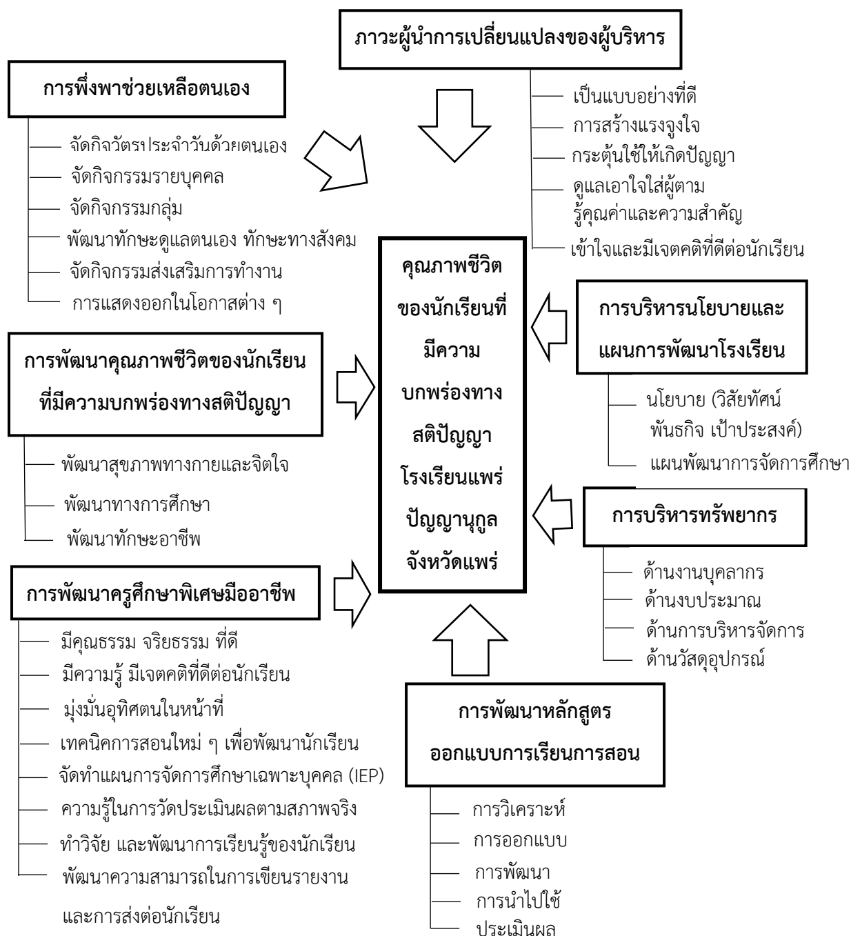
ภาพที่ 11 รูปแบบการบริหารเพื่อพัฒนาคุณภาพชีวิตนักเรียนที่มีความบกพร่องทางสติปัญญา โรงเรียนแพร์ปัญญานุกูล จังหวัดแพร่